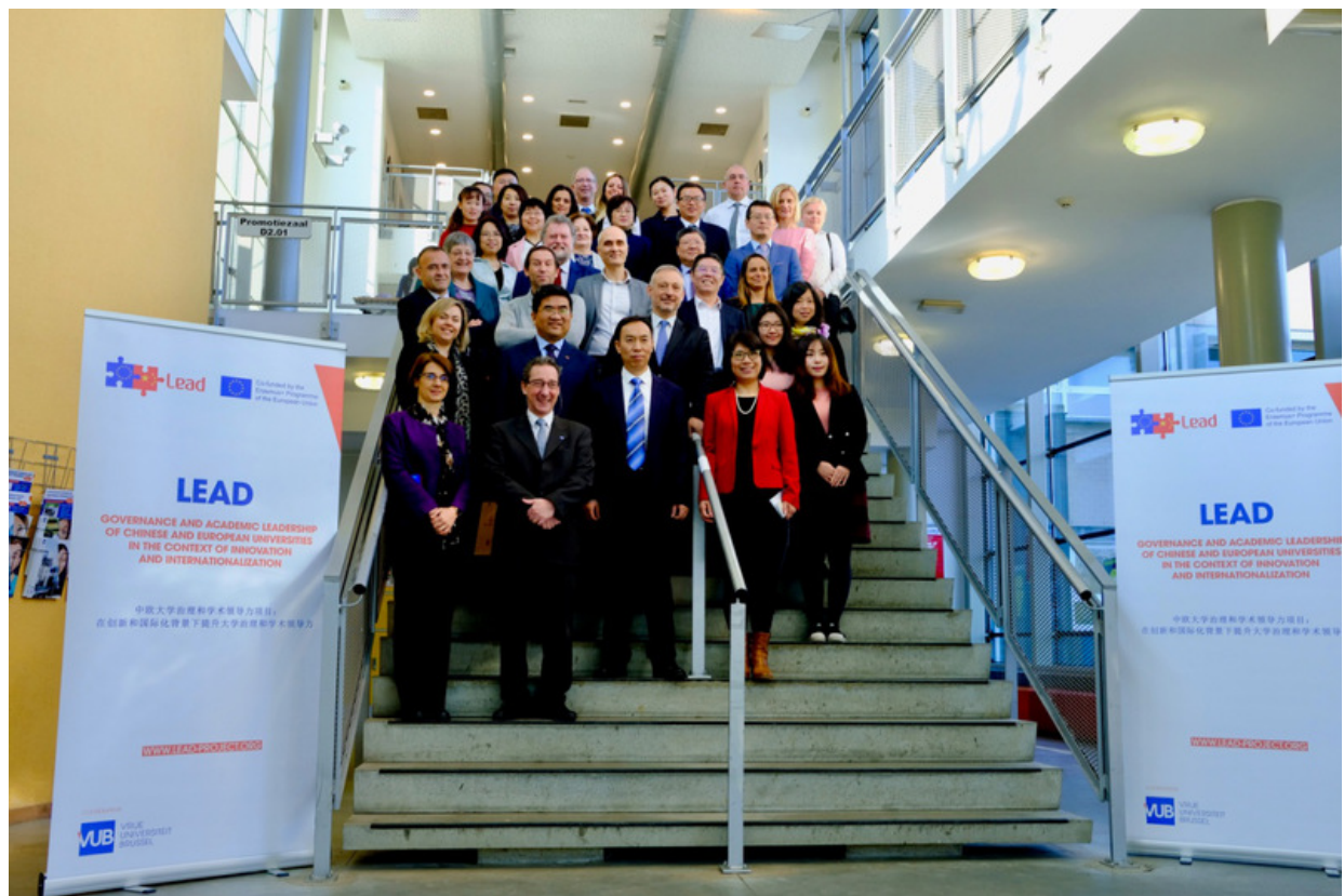
启动仪式代表合影